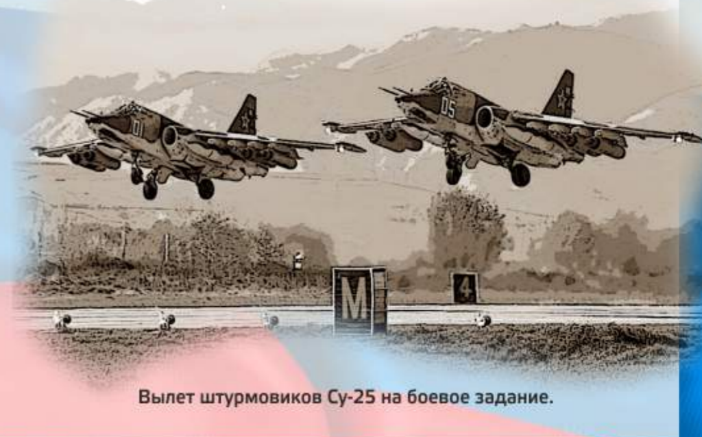
Вылет штурмовиков Су-25 на боевое задание.

Полковник запаса. Заслуженный военный штурман Российской Федерации. Награжден орденами Мужества, «За военные заслуги», медалью «За боевые заслуги», ведомственными и памятным наградами.