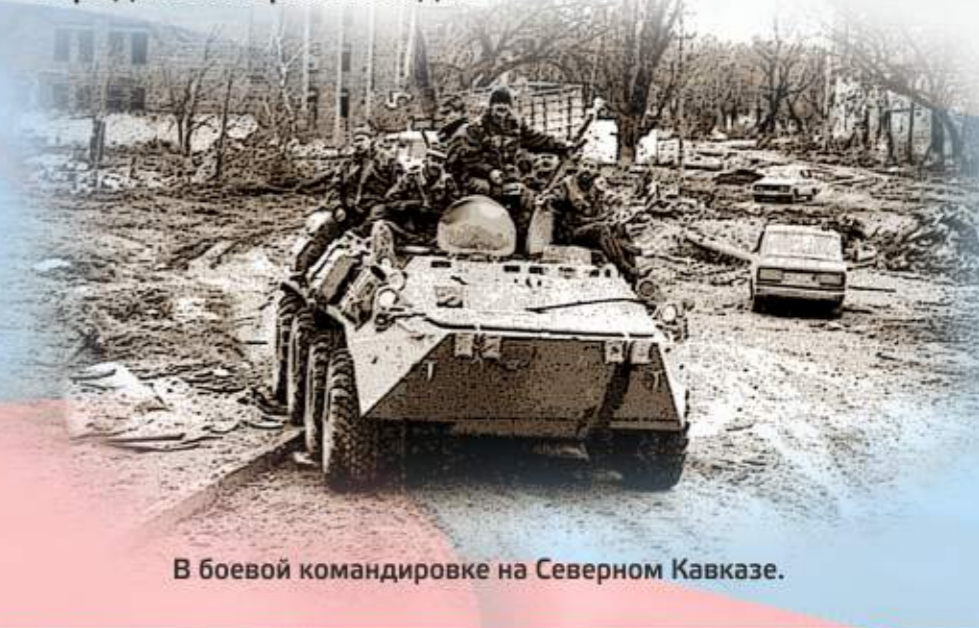
В боевой командировке на Северном Кавказе.