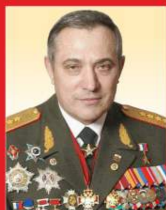
КВАШНИН Анатолий Васильевич