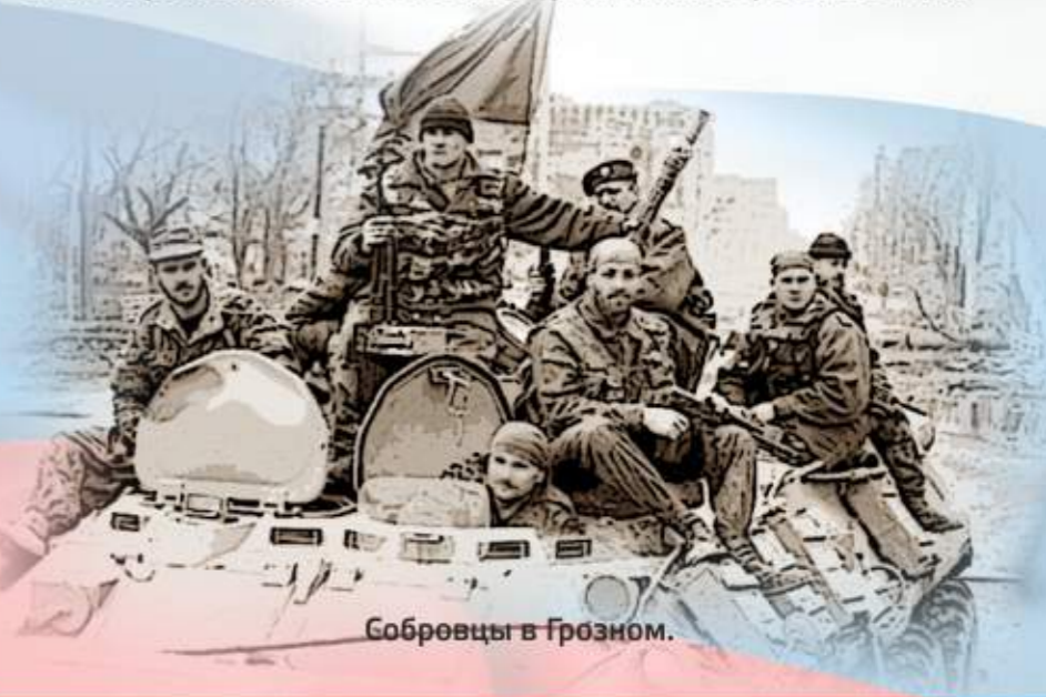
Собровцы в Грозном.

Его имя увековечено на Аллее Героев города Кургана, открытой 16.09.2020 г. в городском Парке Победы.