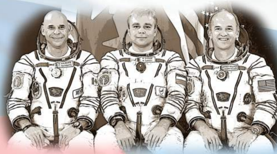
Экипаж корабля «Союз ТМА-16». Сураев М.В. в центре.

С 2010 года - Почётный гражданин Ногинского муниципального района Московской области. В 2011 году Ногинской школе № 5 было присвоено имя космонавта Максима Сураева. В Московской области проводится турнир по регби на призы Героя России лётчика-космонавта Максима Сураева. В Челябинске проводится турнир по бадминтону на призы Героя России лётчика-космонавта Максима Сураева.