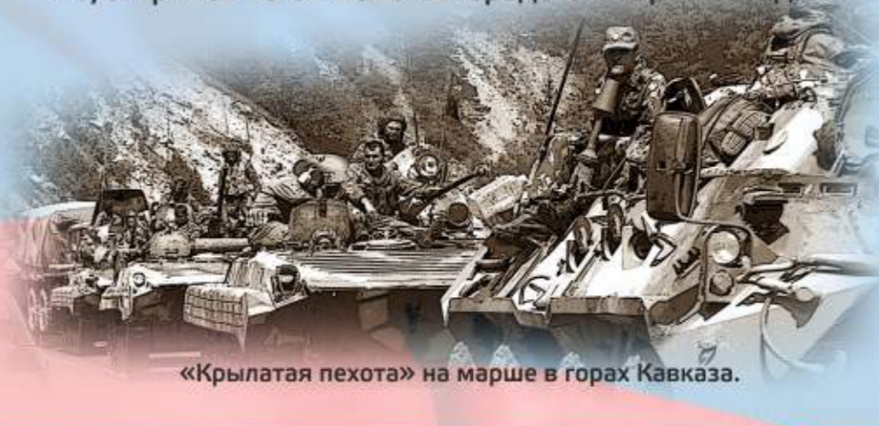
«Крылатая пехота» на марше в горах Кавказа.

В апреле 1981 года призван в ряды Вооружённых Сил СССР. После подготовки в учебной дивизии ВДВ проходил службу санинструктором – спорторганизатором разведывательной роты 317-го парашютно-десантного полка 103-й гвардейской воздушно-десантной дивизии. Выполнял интернациональный долг в Демократической Республике Афганистан в 1981-1982 годах и в 1987-1989 годах. Дважды был ранен.