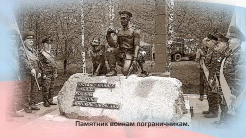
Памятник воинам пограничникам.