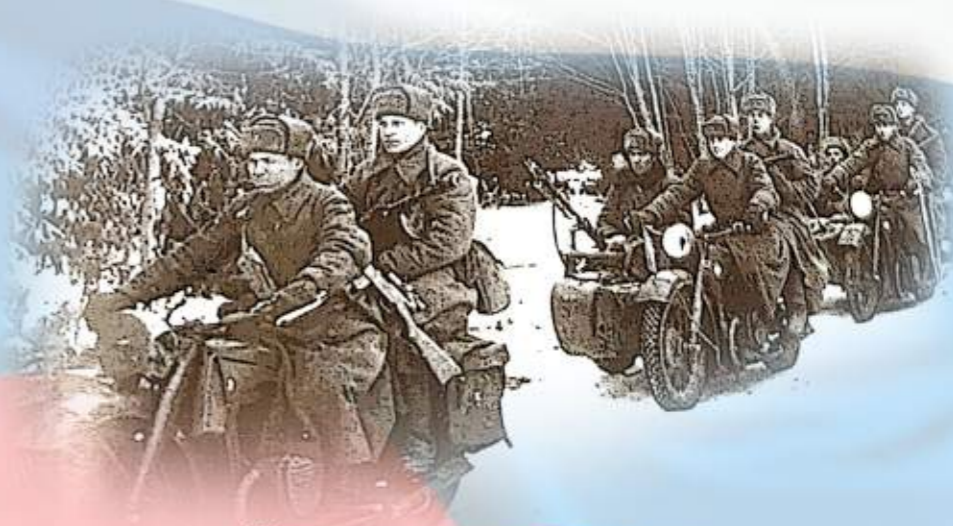
Мотострелки-разведчики на марше.

Его имя увековечено на Аллее Героев города Кургана, открытой 16.09.2020 г. в городском Парке Победы.