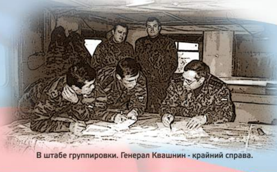
В штабе группировки. Генерал Квашнин - крайний справа.

Его имя увековечено на Аллее Героев города Курган, открытой 16.09.2020 г. в городском Парке Победы.